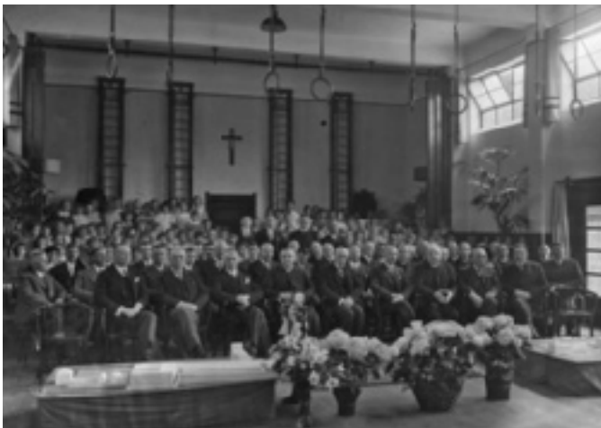
1. Officiële opening van het scholencomplex voor lager en voorbereidend lager onderwijs, Zwarteweg 75, Hekkelaan 197-199 en Z.O. Binnensingel 66 op 28 juni 1934. Haags Gemeentearchief, archief van Lucas Onderwijs en haar rechtsvoorgangers (bnr. 963, inventarisnummer 525).

Deze archieven zijn beschreven door mw. M.E.M. Remery-Voskuil, die bij haar bewerking ook de reeds bij het Haags Gemeentearchief aanwezige bestanden heeft meegenomen. De bestaande toegangen op de archieven van de St. Willibrordusvereniging-Lucas