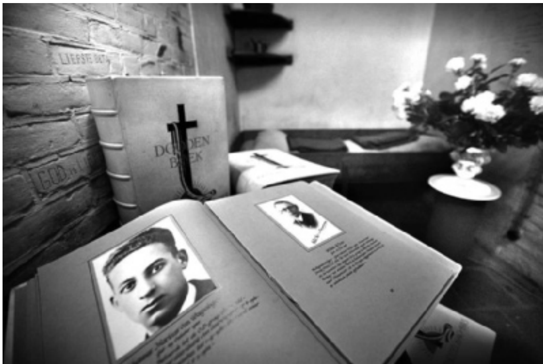
1. Dodencel 601 in de Cellenbarakken van de Scheveningse strafgevangenis. Jaarlijks vindt hier een herdenking plaats; een van de 'Dodenboeken', met afbeeldingen en gegevens van de gefusilleerde verzetsstrijders, ligt dan opengeslagen. Foto Frank Jansen, 2005.