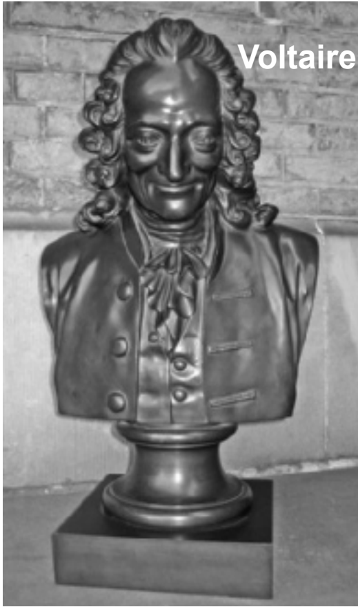
1. Bronzen buste van Voltaire uit circa 1760 in kasteel Twickel, te Delden, in de 18de eeuw het buitenverblijf van de adellijke familie Van Wassenaer.