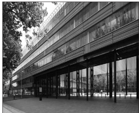
Het Ministerie van Financiën aan het Korte Voorhout

Het in 2007/2008 gerenoveerde gebouw heeft daarentegen een eigentijdse en representatieve uitstraling gekregen waarbij de karakteristieke betonnen gevelpanelen gehandhaafd zijn. Van de zeven verdiepingen zijn er twee ondergronds, in totaal een vloeroppervlak van 66.000 m 2 . Het gebouw biedt ruimte aan 1750 werknemers.