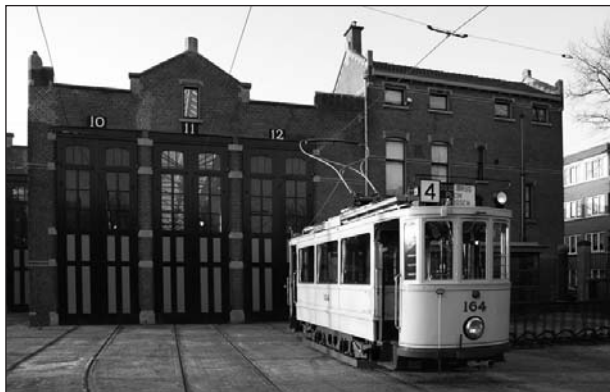
Het Haags Openbaar Vervoer Museum

De remise Parallelweg is gebouwd in 1906 in (de voor tegenwoordige begrippen) recordtijd van een half jaar. Deze remise is gebouwd voor de elektrische tram en heeft