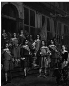
Het Oranjevendel voor de St. Sebastiaansdoelen