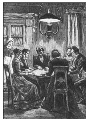
Seance, 19de eeuw

Bij uitgeverij De Nieuwe Haagsche verscheen een curieus boekje in handig zakformaat, Geheim Den Haag geheten. Curieus vanwege de ondertitel: Vrijmetselaerstempels en andere esoterische gebouwen in Den Haag rond 1900 , want die vrijmetselaarsgebouwen beslaan maar 30 van de 270 pagina's – en wat zijn 'esoterische gebouwen'? Curieus ook vanwege de inhoud: een beetje te hooi en te gras, maar wel ontzettend aardig gebracht, worden allerlei Haagse panden belicht met de daarbij behorende 'esoterici' en hun 'beweging',