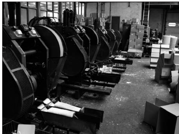
Papierwarenfabriek Jero, erfgoed uit de jaren vijftig

Al sinds enkele jaren heeft de Binckhorst de bijzondere belangstelling van de gemeente Den Haag. Het industrieterrein moet een nieuwe bestemming gaan krijgen, waarbij een grote hoeveelheid woningen het uitgangspunt is. In 2007 was er een plan dat wel aangeduid kan worden als 'Singapore aan de Trekvluit' met veel hoge torens en 7.000 woningen. Veel kritiek kwam hierop uit allerlei hoeken. Ook de SHIE (Stichting Haags Industrieel Erfgoed) gaf hierop een uitgebreide reactie op basis van een door haar uitgevoerde inventarisatie van het industrieel erfgoed van dit tweede industriegebied van de stad. Hieruit bleek duidelijk dat het gebied nog veel van haar oorspronkelijke structuur en bebouwing heeft en dat daarbij veel interessant en waardevol erfgoed is. In de toen voorliggende plannen werd met het erfgoed op een zeer onzorgvuldige wijze omgesprongen. Mede dankzij de inventarisatie van de SHIE is het beeld gaan kantelen en heeft de politiek