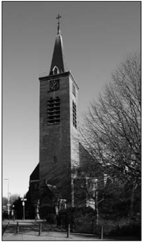
De Paschalis Baylonkerk aan de Wassenaarseweg

van na de oorlog, van de hand van glazenier Alex Asperslagh. Het interieur is nog volledig intact. De kerk is een rijksmonument en onlangs van buiten geheel gerenoveerd.